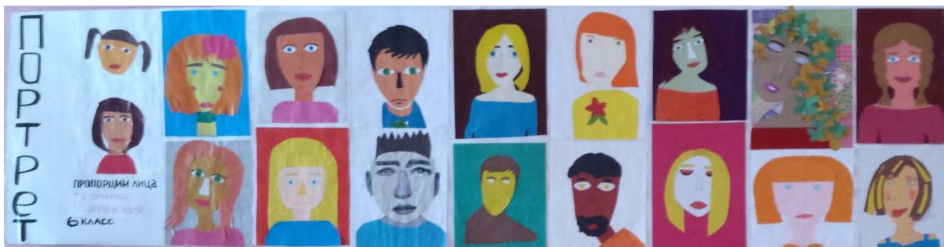
ПОРТРЕТ техника аппликация