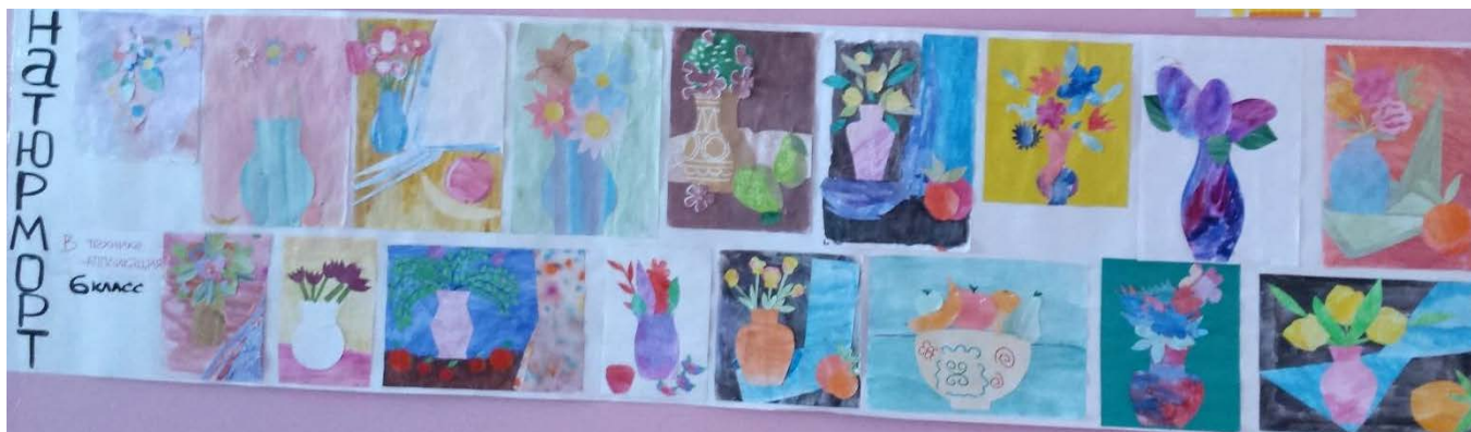
НАТЮРМОРТ техника аппликация